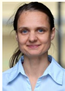
Madlen (Ostdtl., Stipendien)