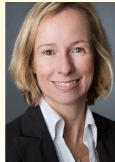
Eva und Lisa: Presse- und Öffentlichkeitsarbeit (z.B. Unterstützung bei Interviews)